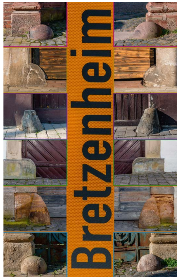
Bretzenheimer Impressionen - unsere Prellsteine

Sie möchten uns unterstützen oder engagiert mitarbeiten? Möchten Sie uns Ihre Ideen und Sorgen mitteilen? Wir würden uns freuen, von Ihnen zu lesen: